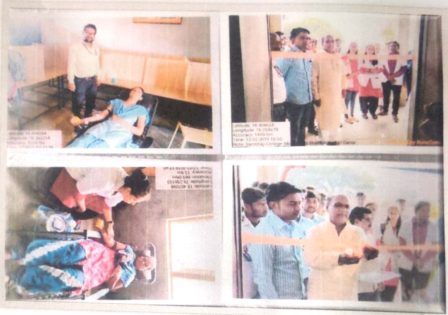
Blood Donation Camp Inaugural Dignitaries and the college stakeholders