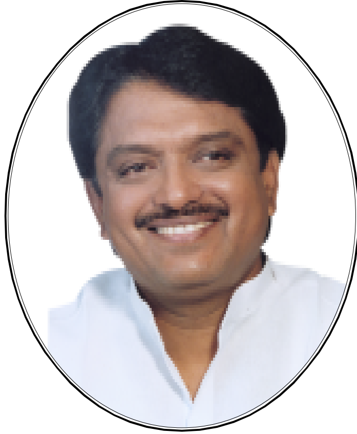
स्व. मा. ना. विलासरावजी देशमुखसाहेब माजी मुख्यमंत्री, महाराष्ट्र राज्य