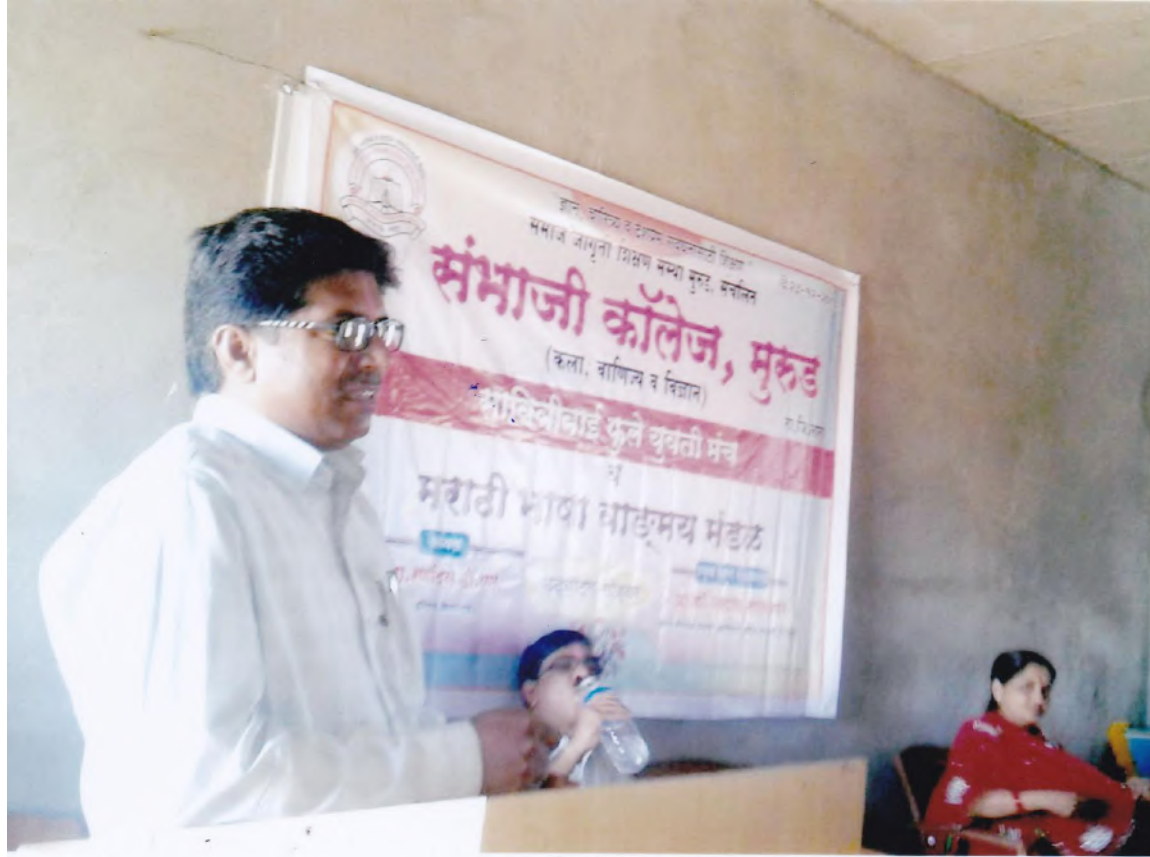
Presidential Speech ...