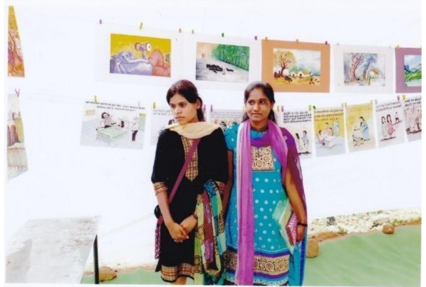
Asmitadarsha Literary meet