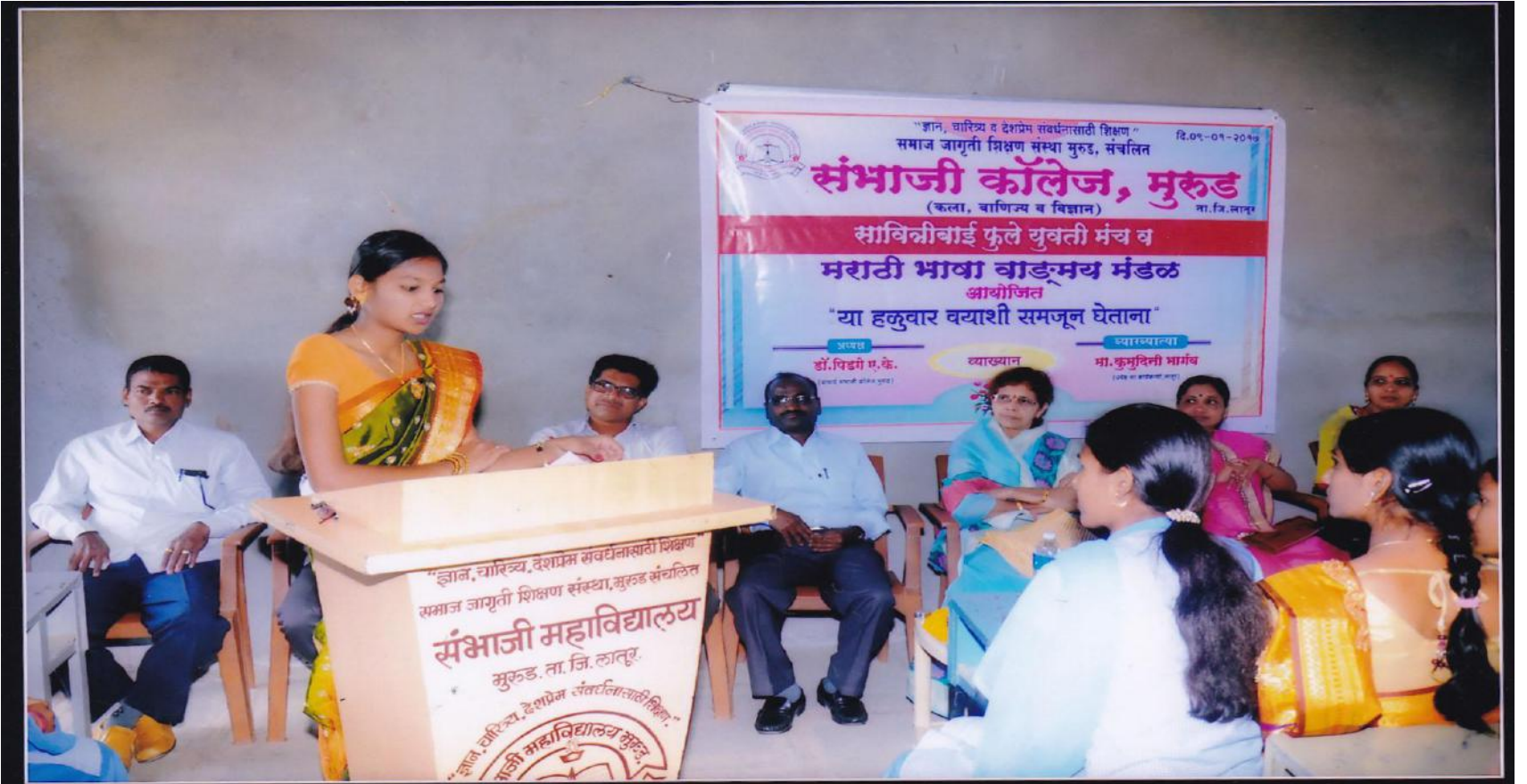
While Student Anchoring