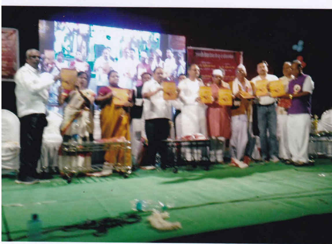
Asmitadarsha literary meet: GranthPrakashan.