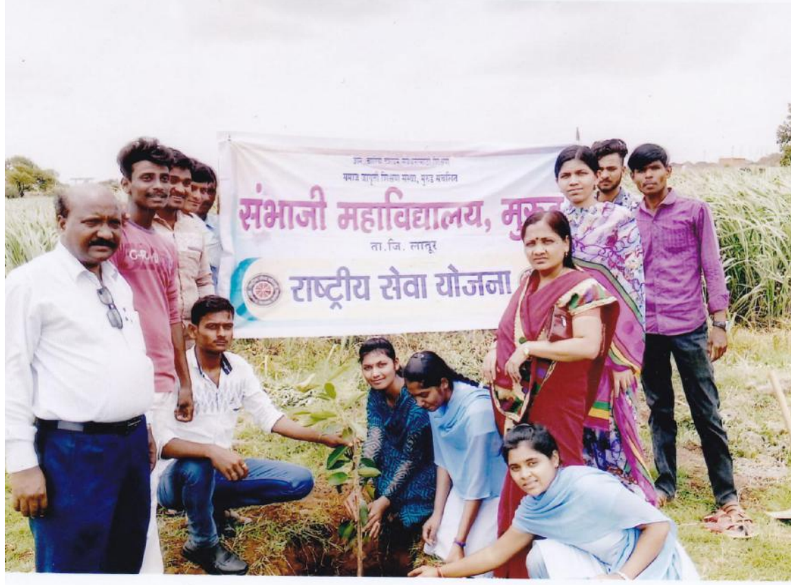
एन.एस.एस. च्या विद्यार्थ्यांच्या समवेत वृक्षारोपण