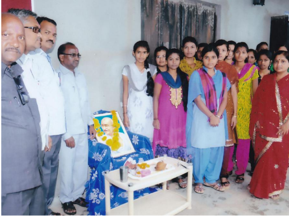
गांधी जयंती साजरी करताना विद्यार्थी व प्राध्यापक वृंद व इतर मान्यवर