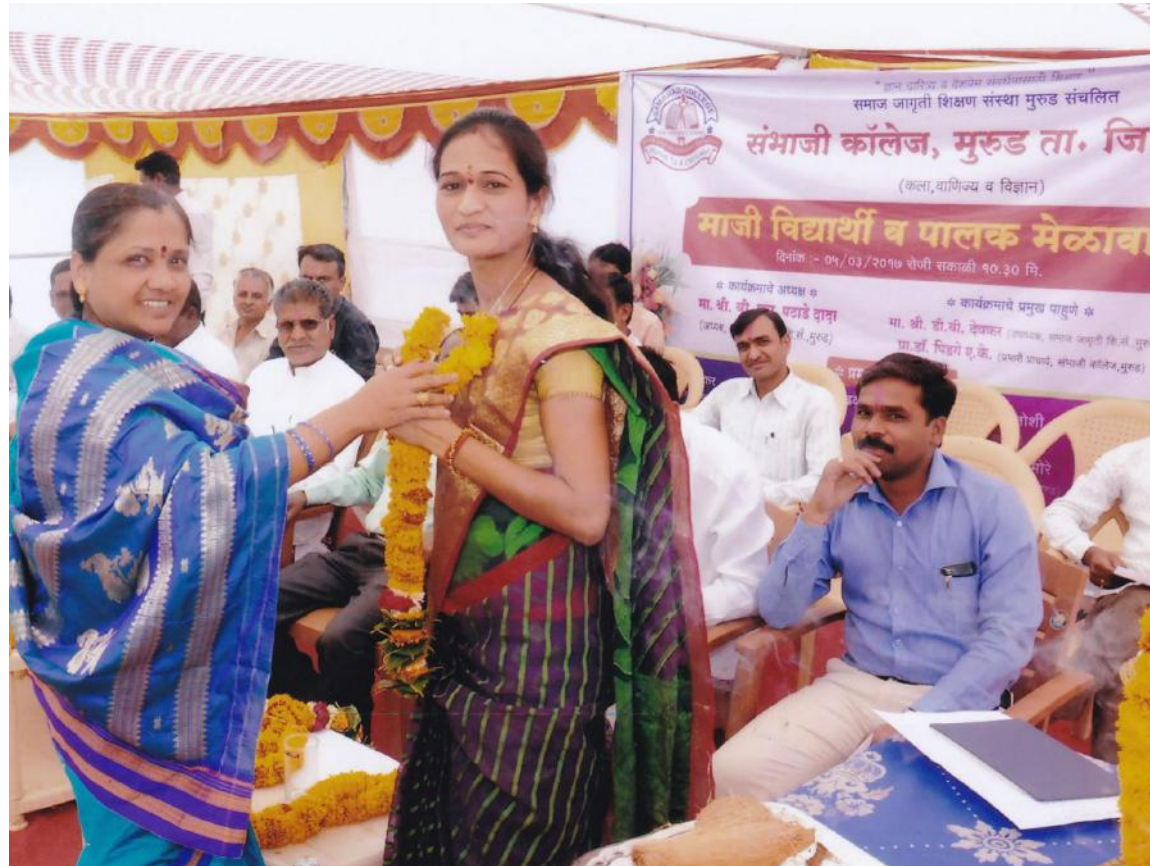
Alumini meet while Felicitating the Alumna.